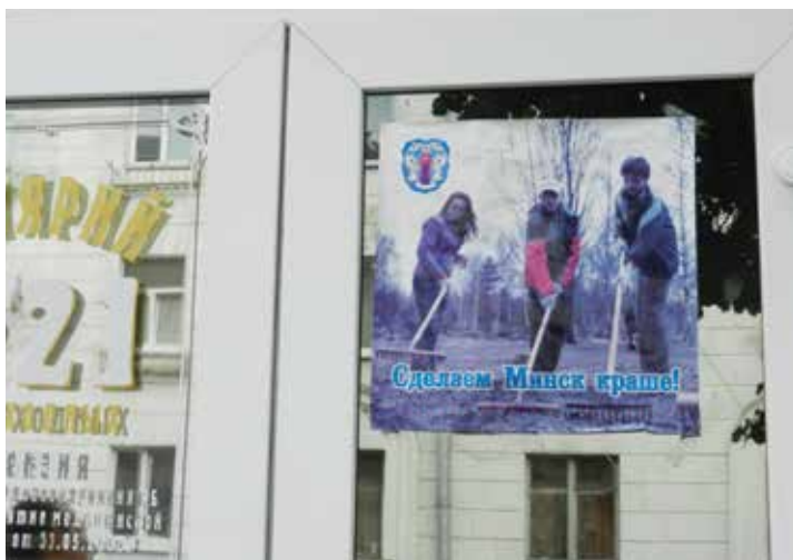
Агитационный плакат на окне магазина, Минск, июнь 2013 г.

Как указано в Статье 2.2.(е) Конвенции МОТ № 29 о принудительном труде, общественные работы не являются принудительным трудом, если они относятся к: «мелким работам общинного характера, то есть работам, выполняемым для прямой пользы коллектива членами данного коллектива, и которые поэтому могут считаться обычными гражданскими обязанностями членов коллектива при условии, что само население или его непосредственные представители имеют право высказать свое мнение относительно целесообразности этих работ.»