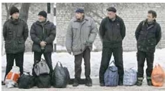
В ожидании отправки в ЛТП, Минск

За нарушение Правил, в том числе отказа от выполнения работ, к лицу, содержащемуся в ЛТП, применяются следующие меры взыскания: предупреждение, выговор, водворение в изолятор на срок до десяти суток.