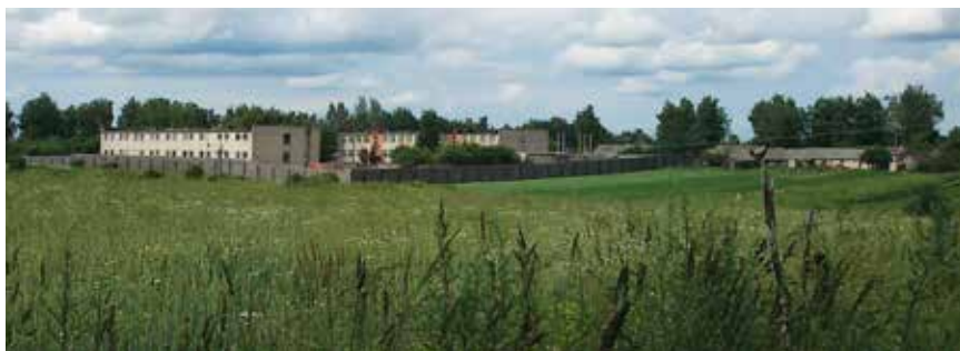
Лечебно-трудовой профилакторий № 2, д. Староселье, Горецкий район Могилёвской области

Не имея возможности получить доступ в ЛТП, миссия съездила в деревню Староселье Могилёвской области, Горецкий район, где находится женский ЛТП №2. При подъезде к деревне миссия могла наблюдать женщин-заключенных ЛТП, косящих траву на обочинах дорог бензино-косилками. В деревне жители рассказали, что очень приветствуют факт размещения ЛТП в их деревне, так как женщины «много полезного делают: чистят, косят, урожаем собирают, за дорогами ухаживают». Вблизи территории ЛТП находится швейная мастерская, в которой работают лишь 23 женщины. Остальные развозятся по предприятиям, с которыми заключен договор. Миссия наблюдала за заездом на территорию ЛТП возвращавшихся с работы женщин. За час 17 транспортных средств доставили порядка 70 женщин. Они прибывали на самых разных видах транспорта — от машин МВД до небольших автобусов на 20 или 10 человек, часть которых явно принадлежала предприятиям. Сопровождение было различным — некоторые группы сопровождалась служащими МВД, часть доставлялись без сопровождения, и их на остановке встречала сотрудница МВД в форме и вооруженная дубинкой и отводила к территории ЛТП. Все женщины были в «вольной» одежде.