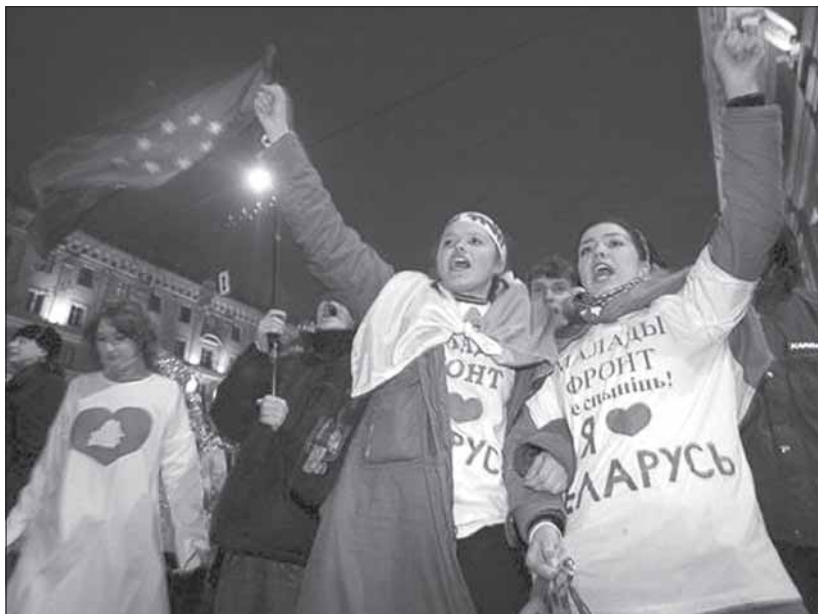
Акцыя «Маладога Фронту» ў Дзень сьвятога Валянціна, Менск