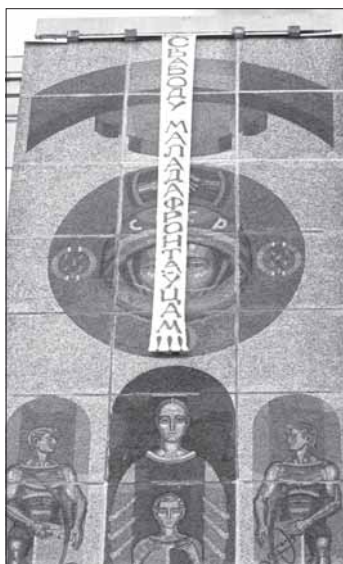
Расьцяжка ў Менску «Свабоду маладафронтаўцам!!!»