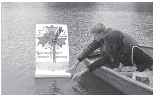
Акцыя «Моладзі БНФ» супраць дыскрымінацыі беларускай мовы, Менск, 1 верасня