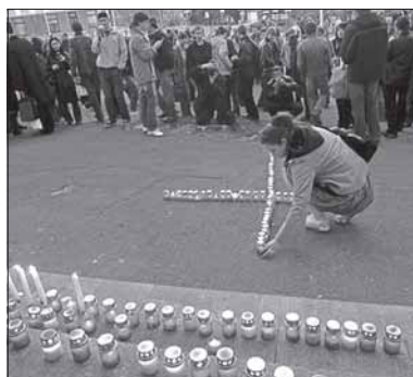
Акцыя ў абарону касцёлу сьвятога Юзафа і бернардынскага кляштара, Менск, 16 красавіка