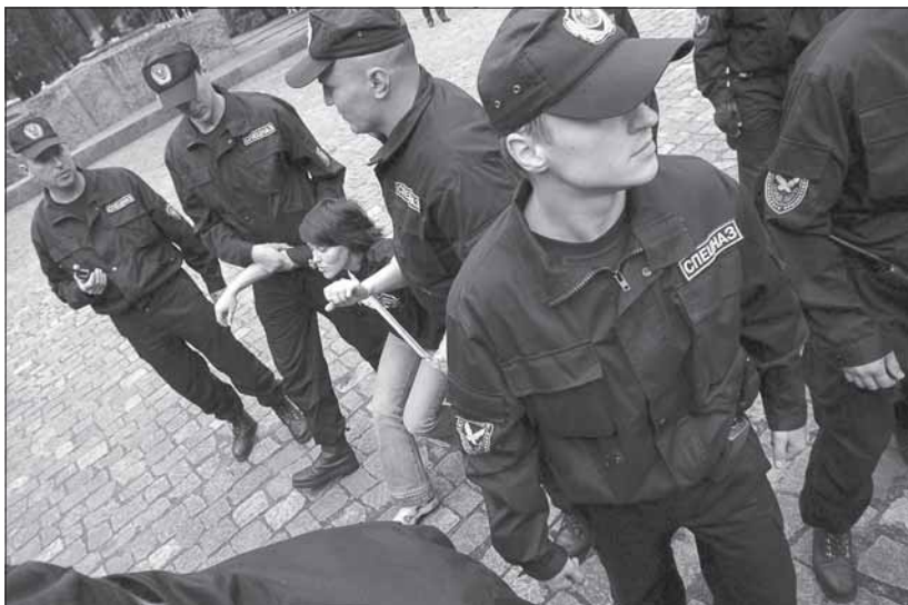
Затрыманьне ўдзельніцы святкавання Дня Незалежнасьці Беларусі, 27 ліпеня, Менск