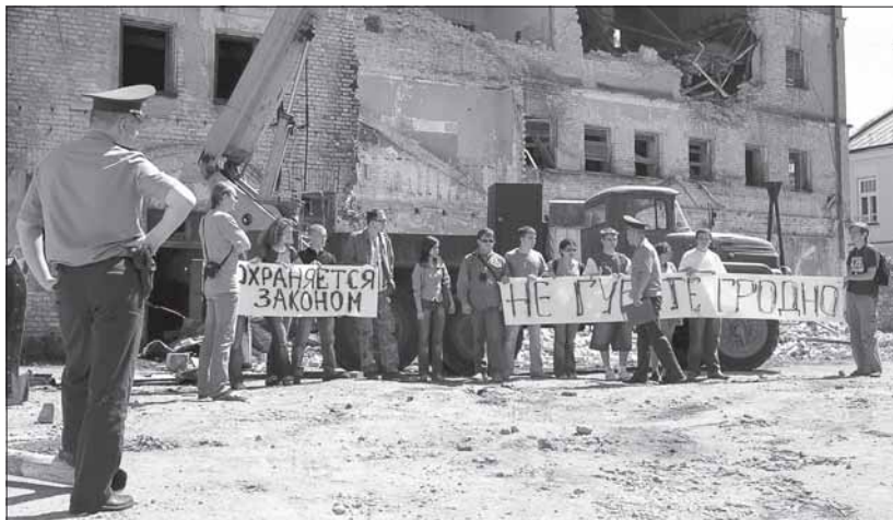
Гарадзенскія актывісты пратэстуюць супраць разбурэння гістарычных будынкаў у цэнтры гораду, Гародня, 24 траўня