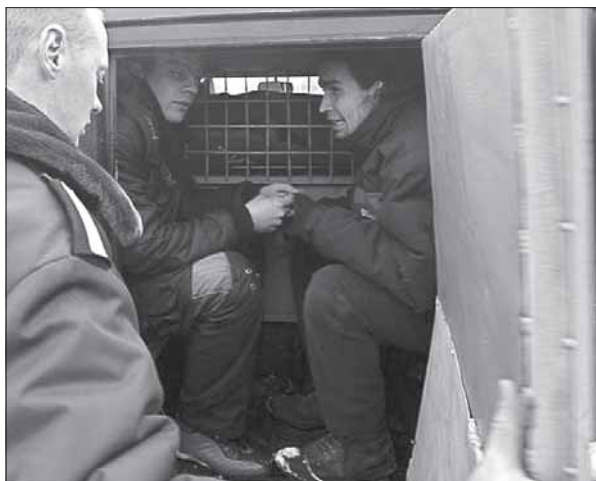
Затрыманыя моладзі ў Дзень сьвятога Валянціна, Менск