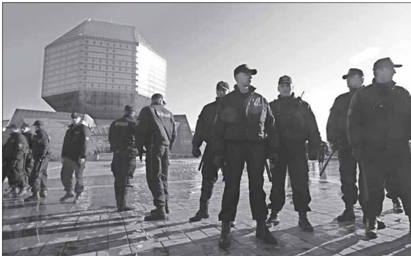
Зачыстка пляцоўкі перад Нацыянальнай бібліятэкай пасля святкавання Дня Волі, 25 сакавіка, Менск