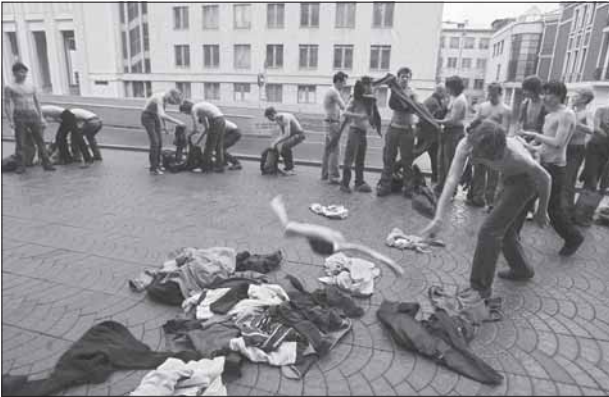
Студэнцкая акцыя супраць адмены ільготаў каля будынку міністэрства адукацыі, Менск, 10 траўня