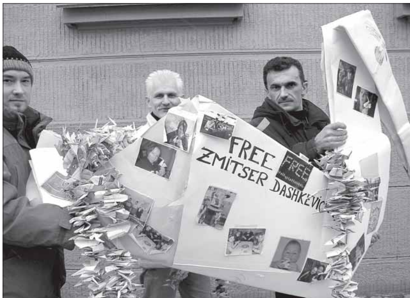
Праваабаронцы перадаюць жураўлікаў, зробленых актывістамі «Міжнароднай Амністыі» ў знак салідарнасьці з беларускімі палітвязьнямі, міністру ўнутраных справаў У. Навумаву, Менск