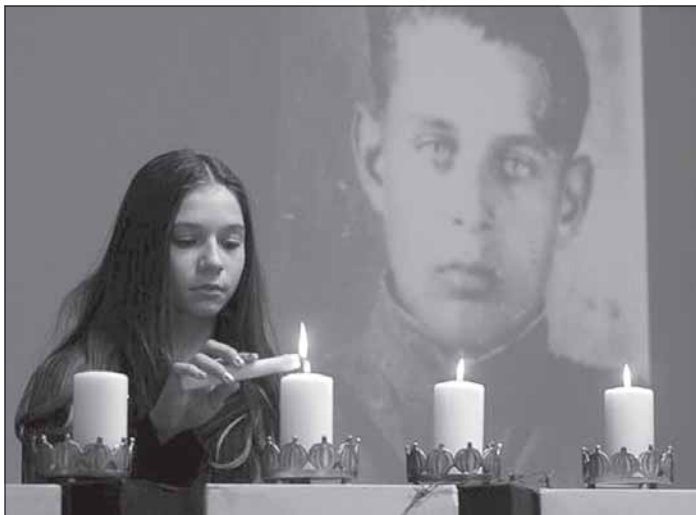
27 студзеня, Дзень памяці ахвяраў Халакосту, Габрэйскі абшчыны дом

Шэсьце ў Курапаты, месца масавых пахаванняў ахвяраў сталінскіх рэпрэсіяў, на «Дзяды», 28 кастрычніка, Менск