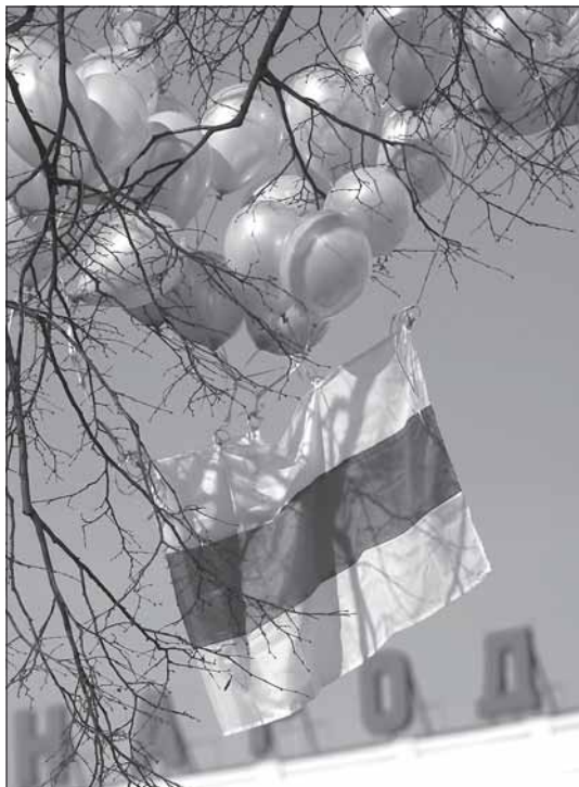
Нацыянальны бел-чырвона-белы сьцяг над плошчай Перамогі ў Менску, 10 сакавіка