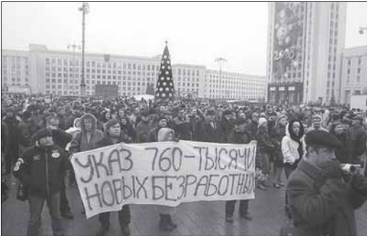
10 сьнежня. Менск. Прадпрымальнікі пратэстуюць

Нацыянальны сьцяг і сьцяг Еўразьвязу на Кастрычніцкай плошчы 4 лістапада, Менск