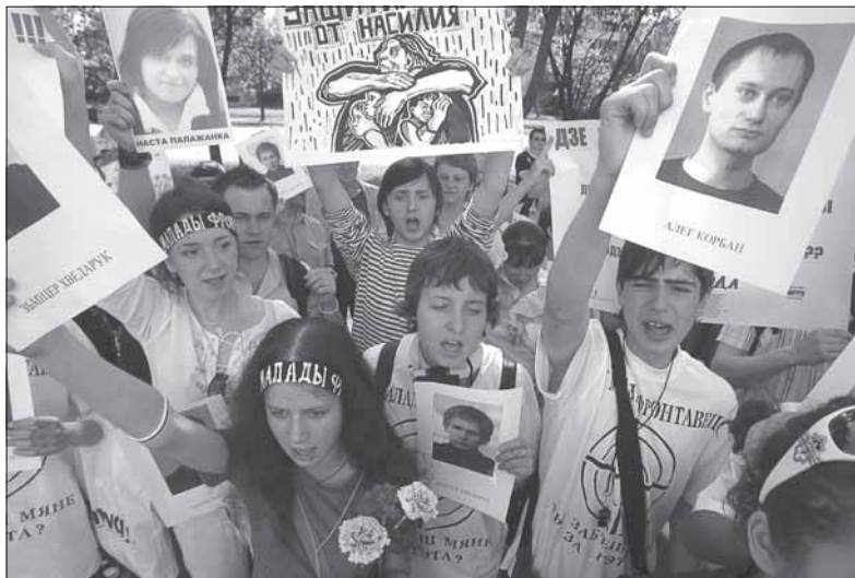
Актыўісты «Маладога Фронту» пратэстуюць супраць крымінальнага перасьледу сваіх сяброў, Менск