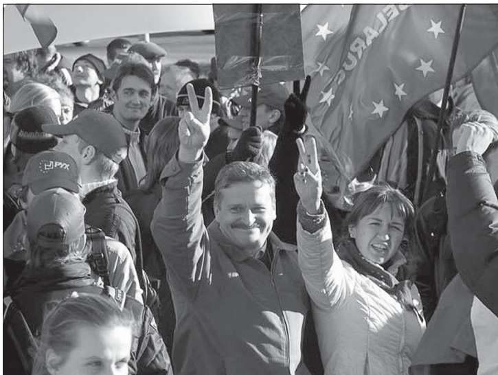
Еўрапейскі Марш, 14 кастрычніка, Менск