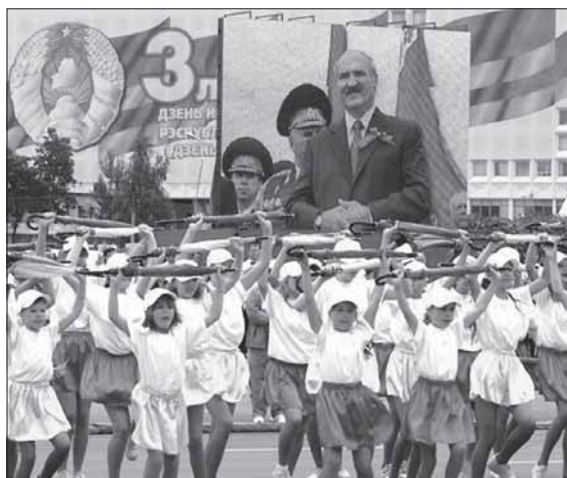
Сьвяткаваньне афіцыйнага Дня незалежнасьці, Менск, 3 ліпеня