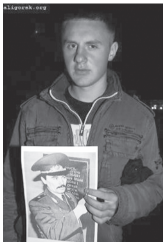
16 октября. Солигорск. Акция солидарности.