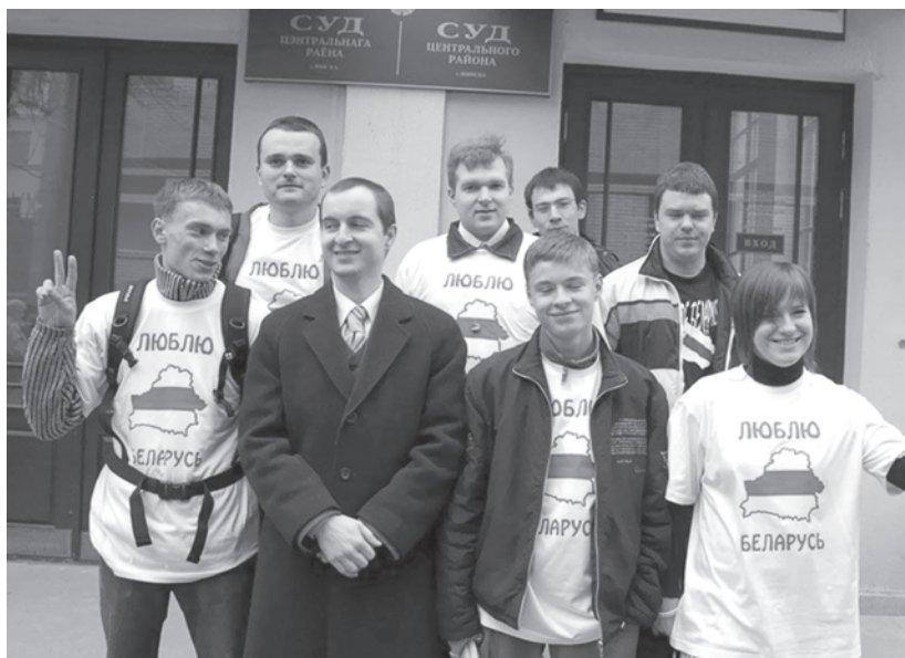
Осужденные по “делу 14-ти”.