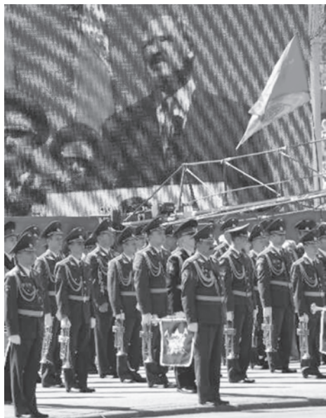
Парад в Минске, посвященный Дню Республики.

Символично. Обрушилась башня минской тюрьмы на ул. Володарского.