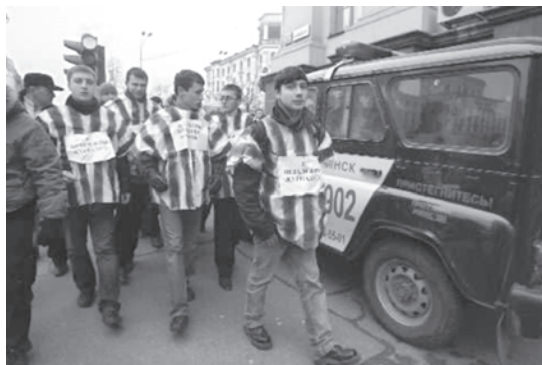
Задержание участников акции, приуроченной ко Дню прав человека.