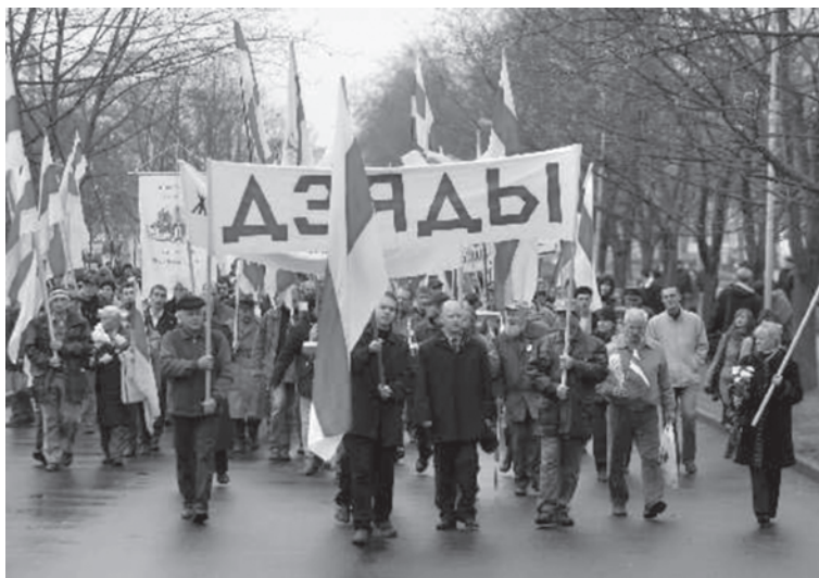
День поминовения предков "Дзяды". Традиционное шествие в урочище Куропаты.