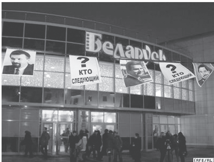
16 декабря. В Минске помнят о политических исчезновениях.