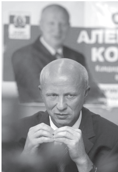
Александр Козулин на свободе.