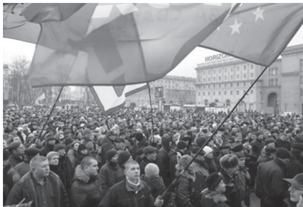
Акция протеста предпринимателей 10 января в Минске.