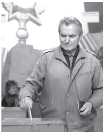
Выборы депутатов Палаты представителей.