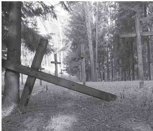
Разрушенные кресты в Куропатах.