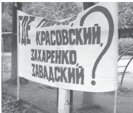
30 августа, Международный день жертв насильственного исчезновения. В Беларуси напомнили об исчезнувших политических и общественных деятелях.