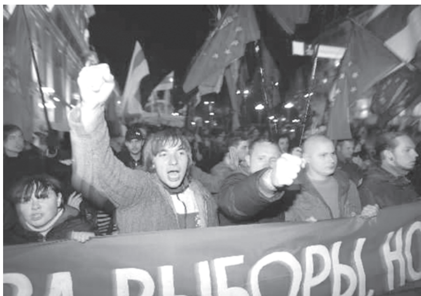
Вечер 28 сентября, Минск. Не все верят объявленным результатам выборов.