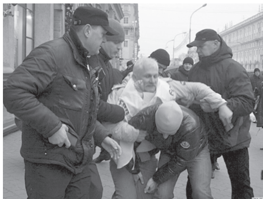
День прав человека. Задержание правозащитника Алеся Беляцкого.