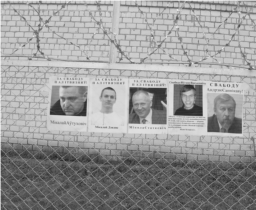
Солидарность с политзаключенными. Бобруйск.