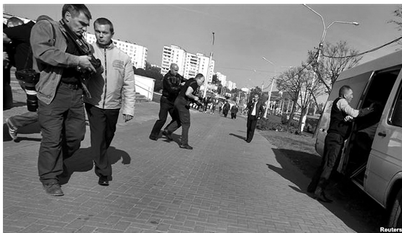
Задержание журналистов во время выполнения профессиональных обязанностей. Акция молодежной организации «Змена» возле университета «Фрунзенский» в Минске. 18.09.2012 г.