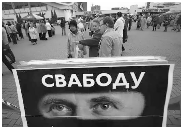
Солидарность с Николаем Статкевичем. Площадь перед Комаровским рынком в Минске, 22.09.2012 г.