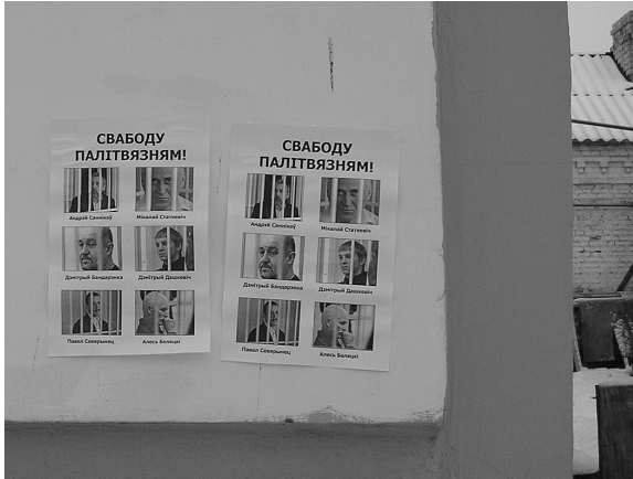
Солидарность с политзаключенными в Орше, Слониме, Полоцке. 2012 год.