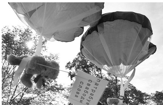
Группа шведов с риском для жизни провела смелую акцию в поддержку белорусского движения за свободу. 03.07.2012 г.