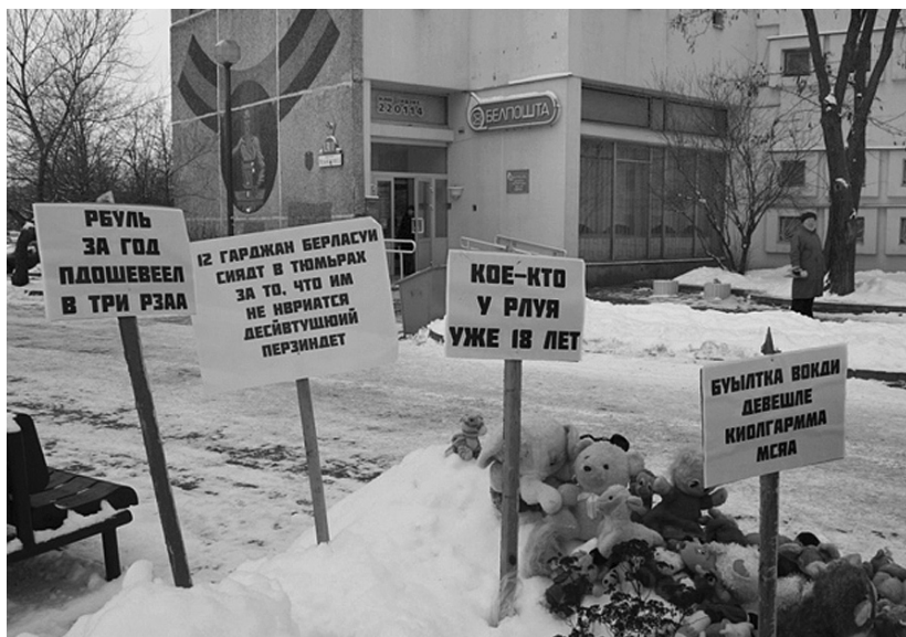
Распространенная форма акций протеста в течение года — с участием игрушек. Организаторы — молодежное крыло «Змена» кампании «Говори правду». В Международный день прав человека напротив Национальной библиотеки. Минск, 10.12.2012 г.