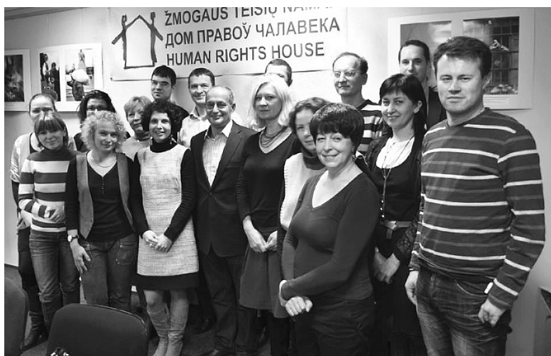
Встреча белорусских правозащитников со спецдокладчиком ООН по Беларуси Миклошем Харашти. Вильнюс, 12-13 ноября 2012 г.