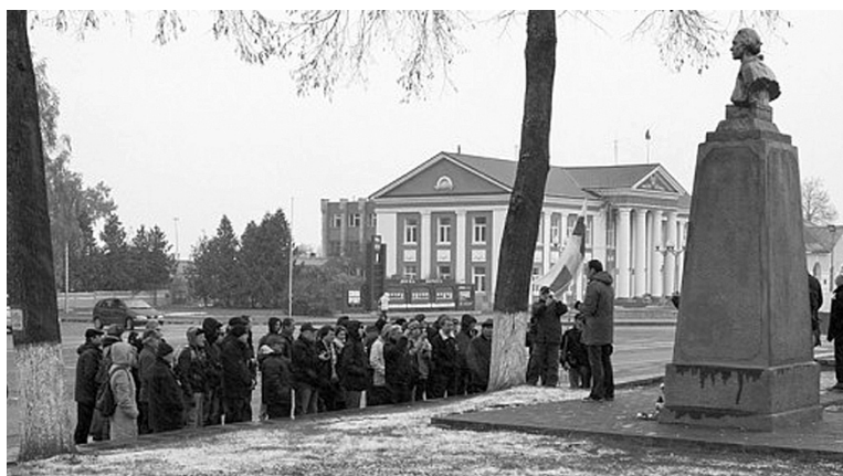
Ежегодная акция памяти повстанцев 1863 года в Свислочи. 27.10.2012 г.