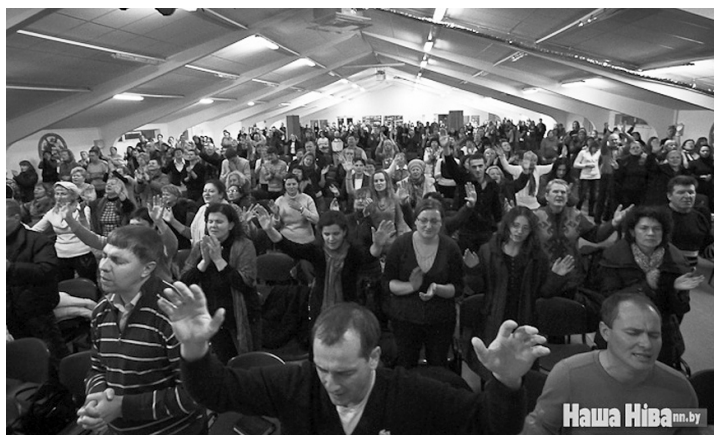
Верующие «Новой жизни» проводят ежедневные молитвы за сохранение здания. Минск, 29.11.2012 г.