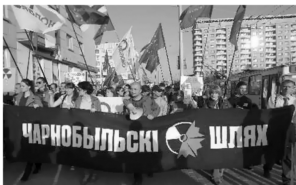
Чернобыльский шлях-2012. Минск, 26.04.2012 г.