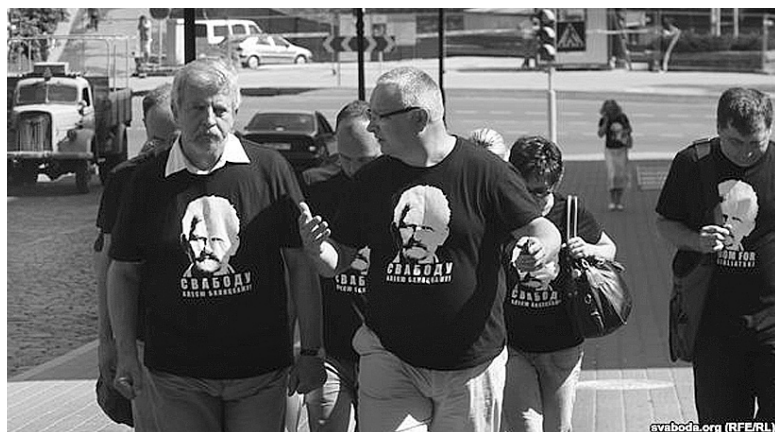
Правозащитники направляются в Администрацию президента, чтобы передать петицию с требованием освободить Аlesia Беляцкого и всех политзаключенных. Минск, 03.08.2012 г.