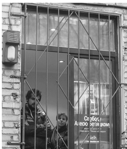
Конфискация офиса Правозащитного центра «Вясна». Минск, пр. Независимости 78А-48, 26.11.2012 г.