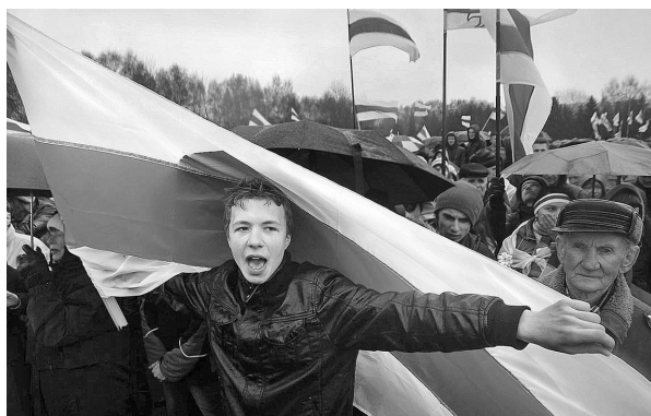
День Воли в Минске в 94-ю годовщину провозглашения БНР. 25.03.2012 г.